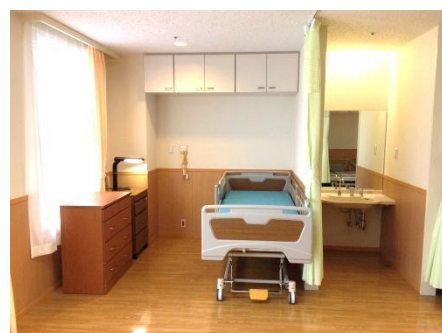
居 室（4 人部屋）

居宅において介護を受けることが一時的に困難になった方に、短期間の生活の場を提供します。