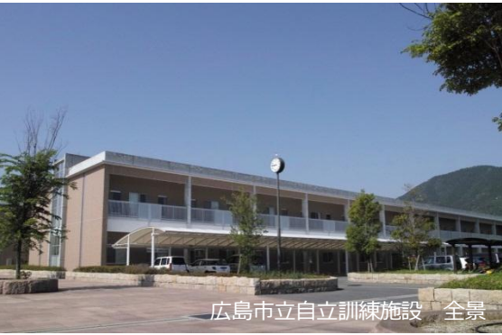
広島市立自立訓練施設 全景